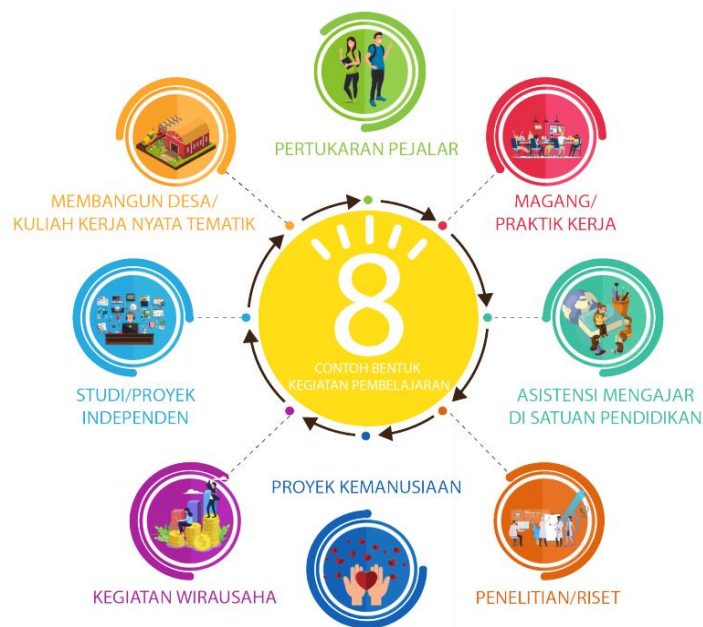
Gambar 1. Kegiatan pembelajaran sesuai Permendikbud No 3 Tahun 2020 Pasal 15 ayat 1

Selaras dengan pembelajaran Kampus Merdeka, kegiatan PKM diharapkan dapat memberikan kesempatan dan tantangan dalam pengembangan kreativitas, inovasi, dan kapasitas, serta kemandirian dalam mencari dan menemukan pengetahuan atau solusi melalui masalah dan dinamika yang ada di masyarakat. Penjelasan rekomendasi konversi sks dapat dilihat di Buku Pedoman Umum PKM. Menurut Permendikbud No 3 Tahun 2020 Pasal 15 ayat 1. Bentuk kegiatan pembelajaran yang sesuai terlihat dalam Gambar 1.