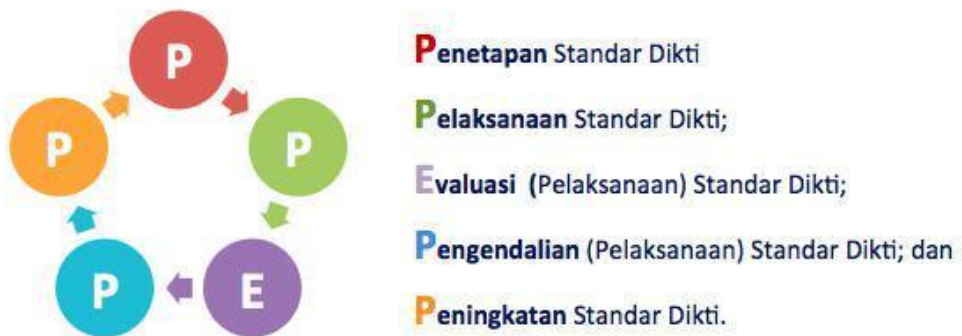
Gambar 1. Siklus SPMI

Mekanisme SPMI UNJ diawali dengan mengimplementasikan SPMI melalui siklus kegiatan yang disingkat sebagai PPEPP , yaitu terdiri atas: